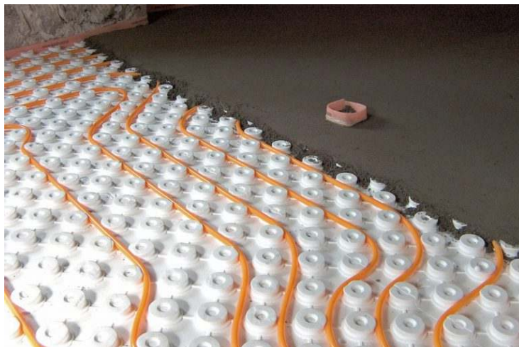
Bild 3: Die wasserführenden Rohre werden z.B. in Noppenplatten eingelegt und dann mit einer Vergussmasse bedeckt

Wegen des erhöhten Aufwands dieser Variante wählen Bauherren für die Nachrüstung meist ein Trockensystem. Bei dieser Installationsart werden die Rohre direkt unterhalb des Bodenbelags auf Trockenestrichplatten mit einer speziellen Dämmung installiert ( Bild 2 ).