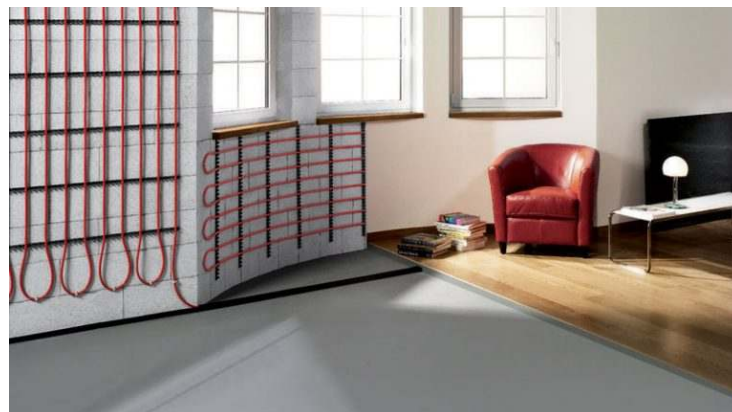
Bild 4: Nicht nur Fußböden, sondern auch Zimmerwände eignen sich hervorragend zur Wärmeabgabe

2. Rohrsystem in Unterkonstruktion mit Trockenausbauplatten: Diese Ausführung entspricht Bauart B nach DIN EN 1264. Die Rohrleitungen liegen zwischen der Unterkonstruktion und sind in den Systemdämmplatten verlegt. Meistens dienen Wärmeleitbleche und Trockenbauplatten als Abdeckung.