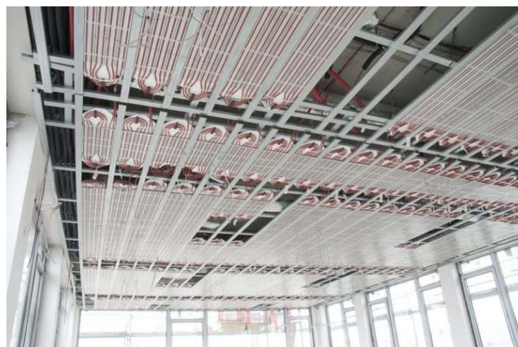
Bild 5: Für die zusätzliche Kühlung im Sommer bieten sich die Deckenflächen besonders an

2. Rohrsystem in oder auf Trockenbauplatte: Diese Variante entspricht ebenfalls der Bauart A nach DIN EN 1264. Die Systemplatten bestehen aus Trockenbauplatten mit integrierten Rohrleitungen und werden auf einer Unterkonstruktion an der Decke befestigt.