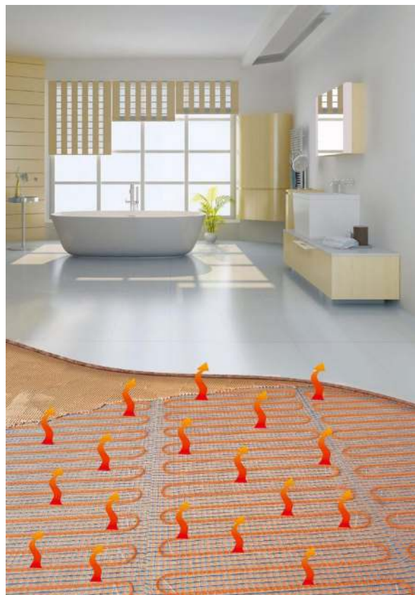
Bild 6: In Badezimmern wird häufig eine elektrische Fußbodenheizung eingesetzt – entweder als Vollheizung oder als Fußbodentemperierung zur Steigerung des Wohnkomforts

Entscheidend für den sicheren Betrieb einer Flächenkühlung ist die Einhaltung bestimmter regelungstechnischer Aspekte. Hierzu zählt im Wesentlichen die Vermeidung der Unterschreitung der Wasserdampftaupunkttemperatur auf der kühlenden Raumfläche. Deshalb darf die Kühlwassertemperatur nicht beliebig tief abgesenkt werden, um eine höhere Kühlleistung zu erzielen.