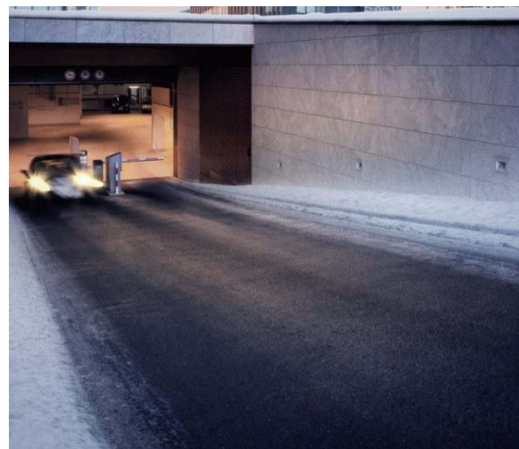
Bild 7: Die Vorteile einer elektrischen Freiflächenheizung liegen auf der Hand: energieeffizient durch intelligente Regel- und Überwachungssysteme, kurze Reaktionszeit und geringe Investitions- und Einbaukosten sind nur einige

Die Einsatzgebiete sind breit gefächert. Neben Fahrbahnen, Einfahrten, Bürgersteigen oder Parkflächen, können auch Treppen und Ablaufrinnen mit der Technik Schnee- und Eisfrei gehalten werden. Eine Heizleistung von 200 bis 400 W/m 2 bei Freiflächen und 300 bis 500 W/m 2 bei Stufen kann als Richtwert gelten. Anbieter von Freiflächenheizungen, die hier kompetent beraten können, sind auf der Website www.flaechenheizung.de zu finden.