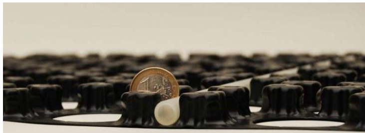
Bild 2: Durch die niedrige Aufbauhöhe eignen sich die Systeme auch für den nachträglichen Einbau

Egal ob es sich um eine Modernisierung oder um einen Neubau handelt, ob ein Trocken- oder Nasssystem gewünscht wird, der Markt bietet viel im Bereich der Flächenheizung und -kühlung. Bei Modernisierungen werden derzeit meist Fußbodenheizungen eingesetzt, wobei der Anteil der Wand- und